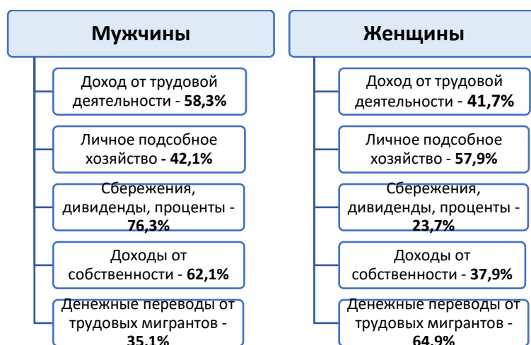
Рисунок 2. Распределение населения трудоспособного возраста РТ в разрезе пола по отдельным источникам средств к существованию (по результатам переписи населения 2010 года) 10

По источникам средств к существованию между женщинами и мужчинами трудоспособного возраста можно увидеть существенные различия и большую социально-экономическую уязвимость женщин. Показатель по такому источнику доходов, как сбережения и дивиденды фиксирует еще большее ограничение возможностей женщин, по сравнению с мужчинами. Доля женщин ограничивается только 23,7%. Среди сельского трудоспособного населения, получающего доход от сбережений и дивидендов, доля женщин около 19%.